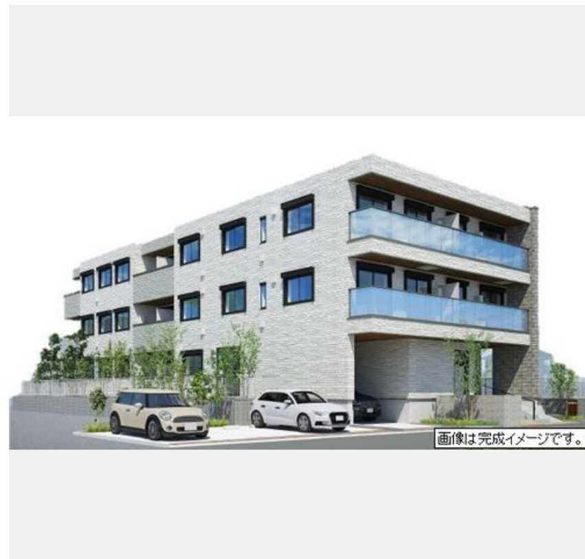
画像は完成イメージです。