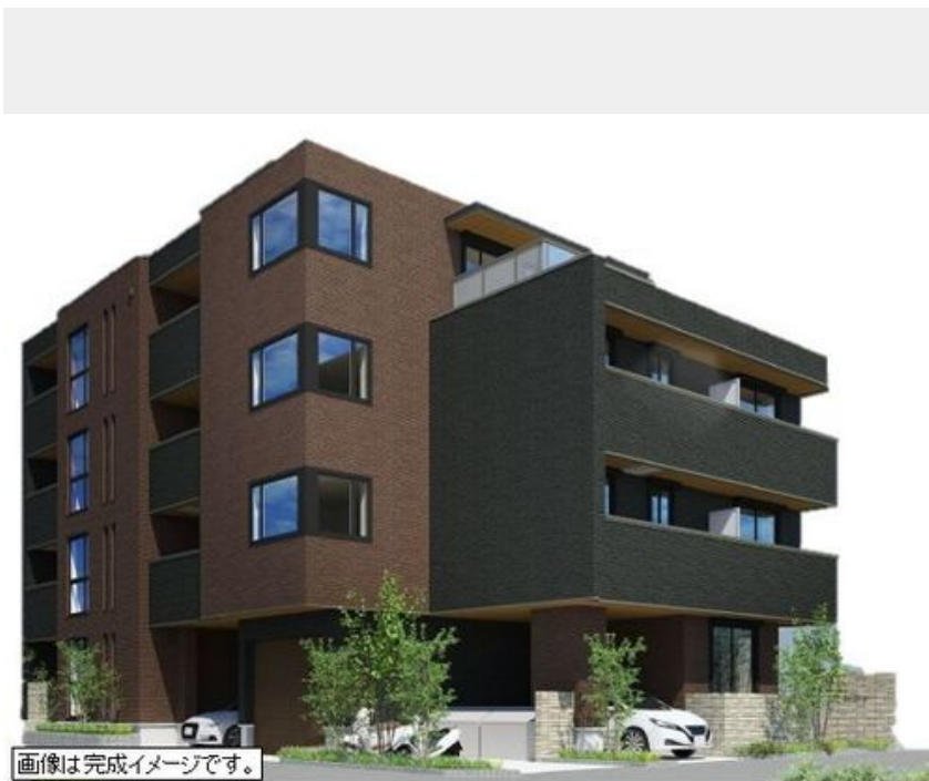
画像は完成イメージです。