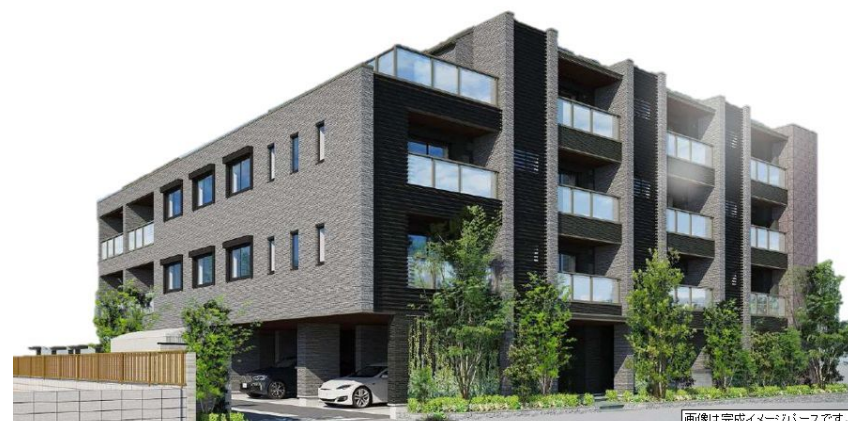
画像は完成イメージベースです。