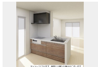
※イメージになります。実際とは異なる場合がございます。