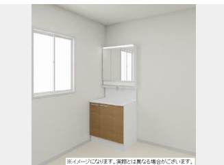
※イメージになります。実際とは異なる場合がございます。