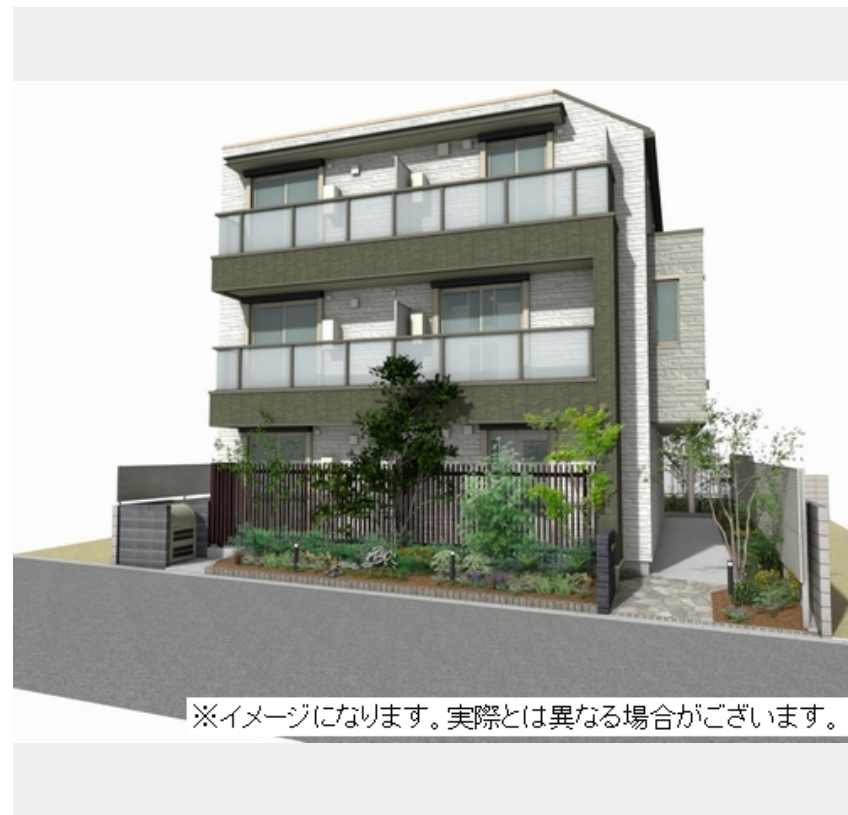
※イメージになります。実際とは異なる場合がございます。