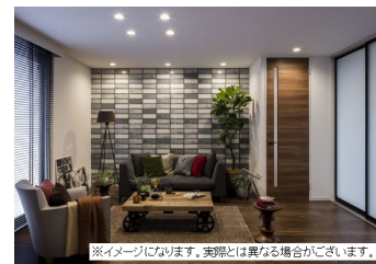
※イメージになります。実際とは異なる場合がございます。