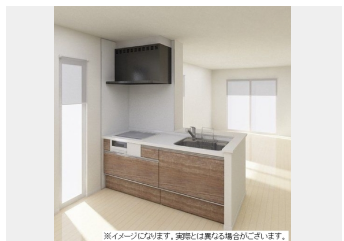
※イメージになります。実際とは異なる場合がございます。