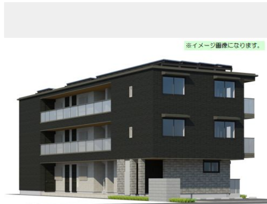
※イメージ画像になります。