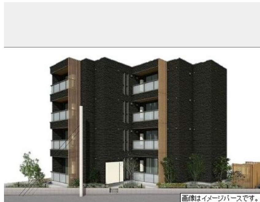
画像はイメージパースです。