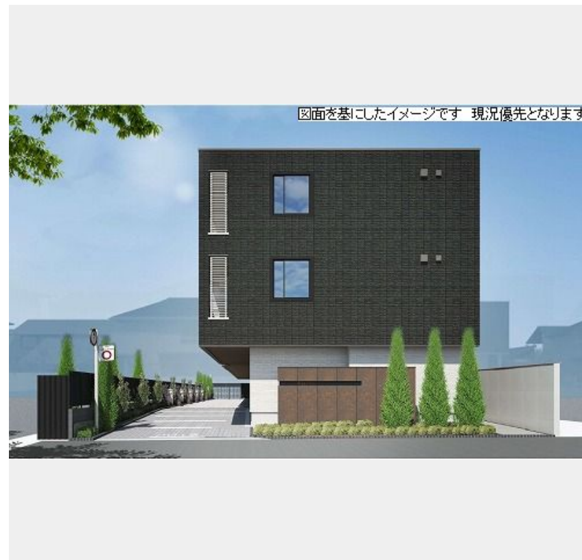
図面を基にしたイメージです 現況優先となります