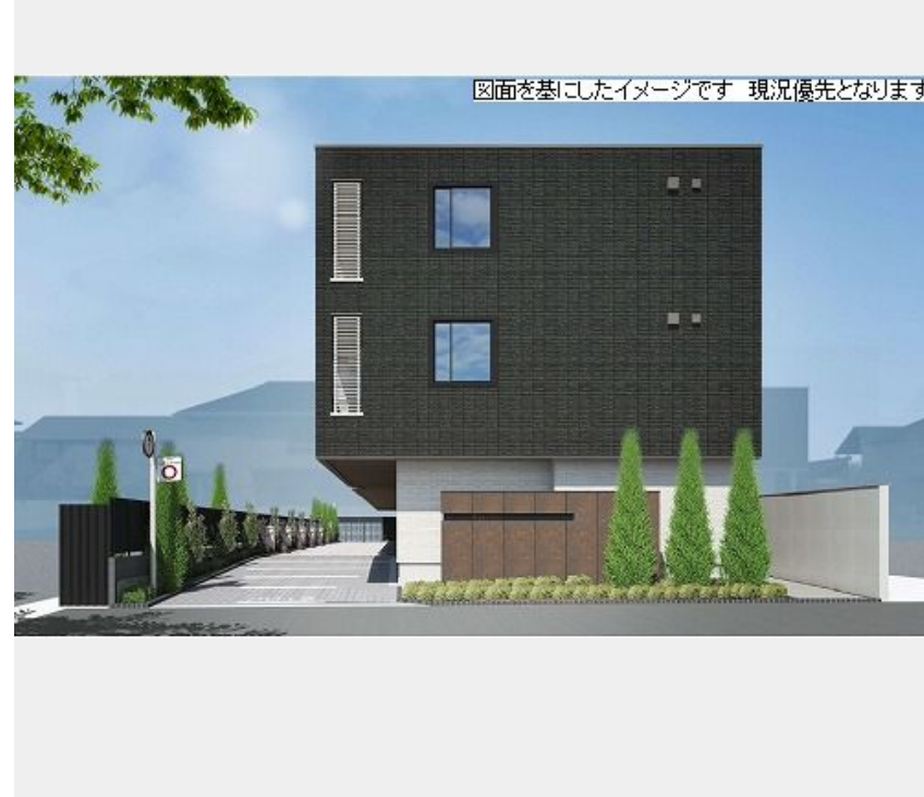
図面を基にしたイメージです 現況優先となります