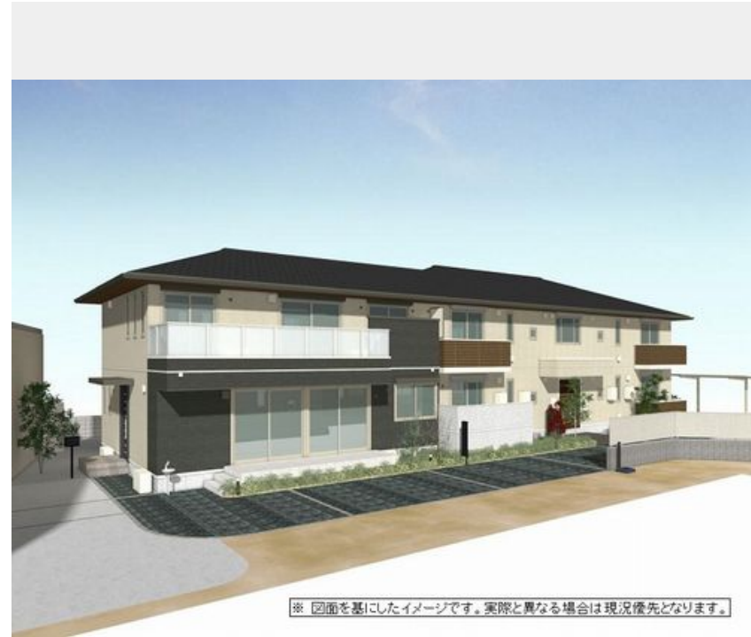
※ 図面を基にしたイメージです。実際と異なる場合は現況優先となります。