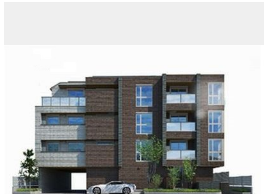
※イメージ画像のため実際と異なる場合がございます。