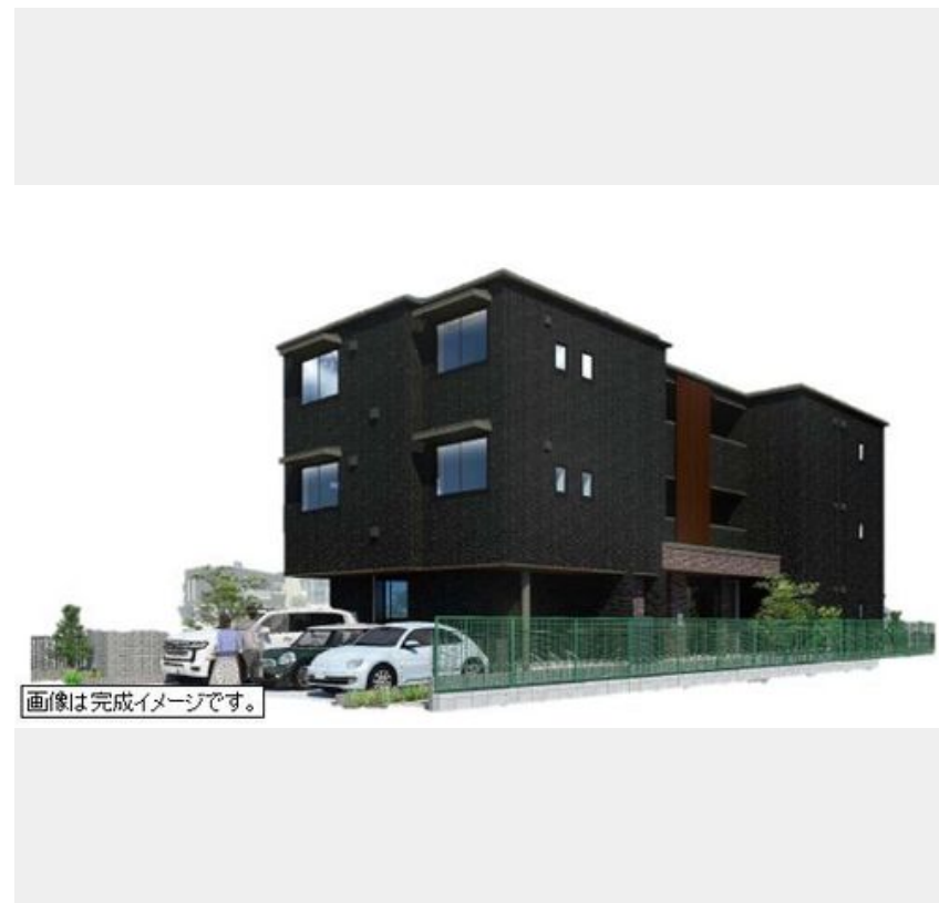
画像は完成イメージです。