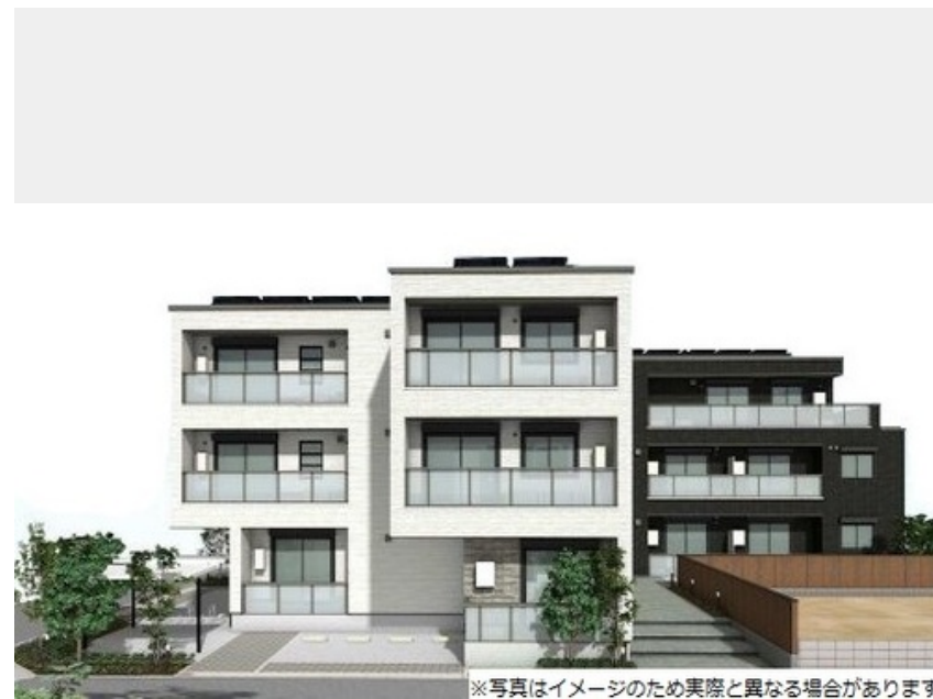
※写真はイメージのため実際と異なる場合があります