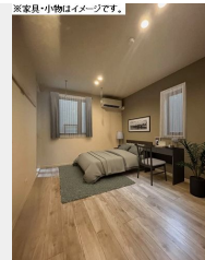
※家具・小物はイメージです。