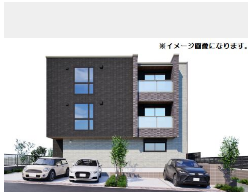
※イメージ画像になります。