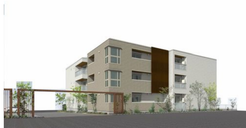
※イメージパースの色、色、構等は実際とは異なります。