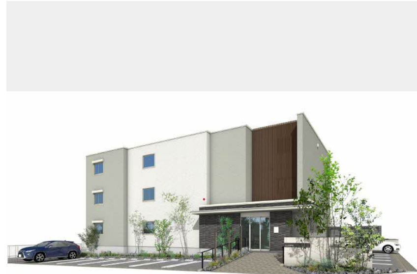
※完成イメージパース