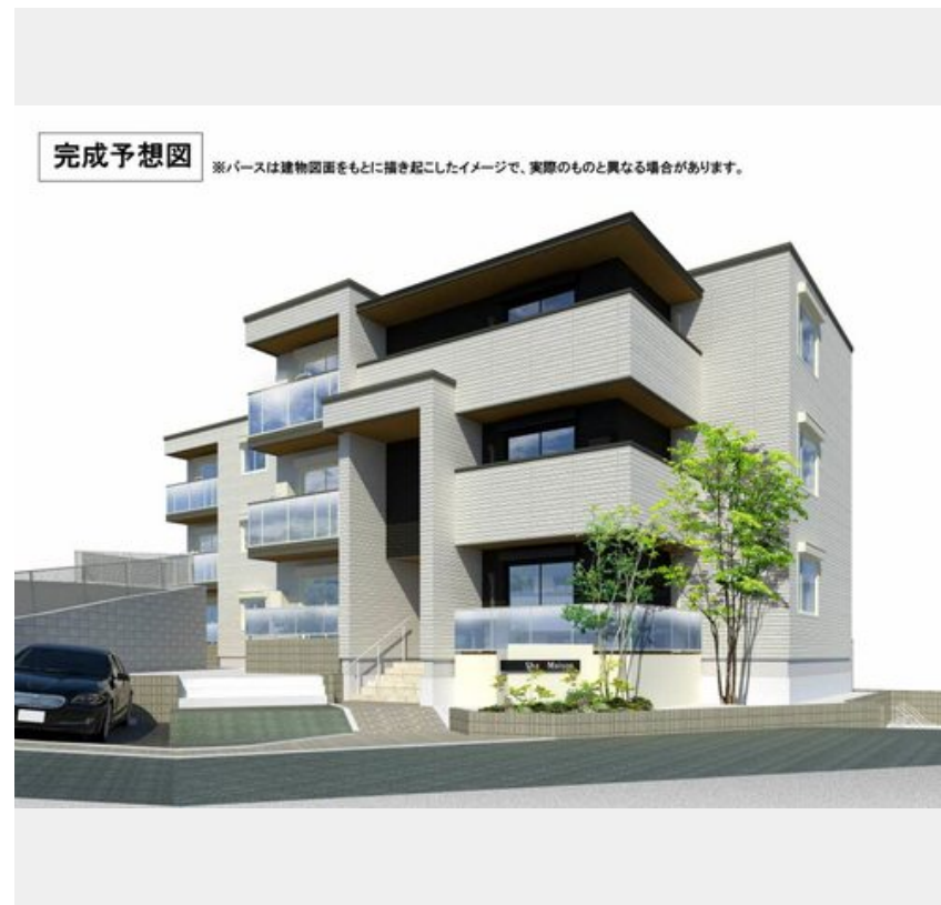
完成予想図 ※パースは建物図面をもとに描き起こしたイメージで、実際のものとは異なる場合があります。