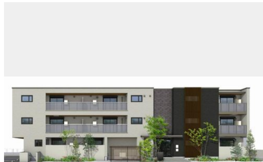
【完成予想図】 パースは実際の図面をもとに書き起こしたイメージで実際のものとは異なる場合があります。