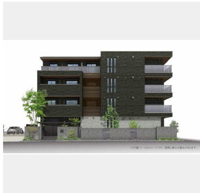
※外観・内装はイメージです。実際と異なる場合があります。